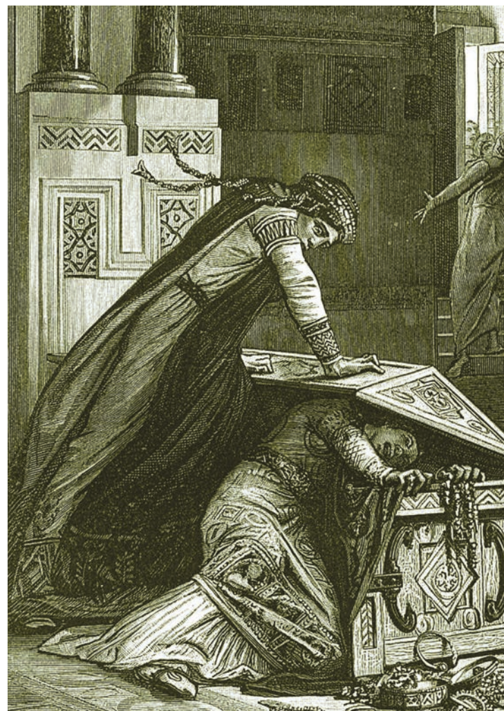
Fredegunda var også grusom. Her forsøker hun å myrde datteren Rigundis.

Merovingerne har betegnelsen etter MEROVECH, Klodvigs far og frankernes fører på De Kataluniske Marker.