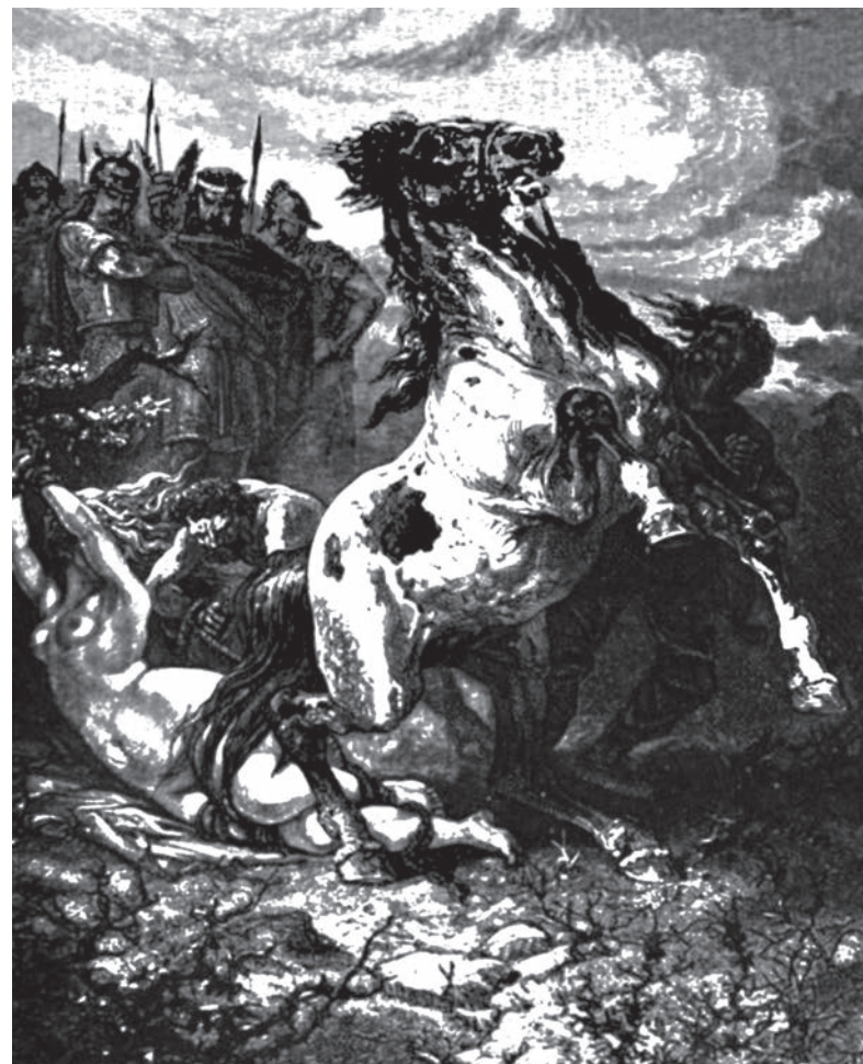
Brynhilda måtte svare for mordet på 10 fyrster, og gjennomgå den grusomste tortur og død (613).

Som adelig var Gregor(ius) tilknyttet de merovingiske hoff og skrev en svært detaljert krønike, FRANKERNES HISTORIE. 10 bøker om epoken fra bibelsk tid til sin egen død i 594. Ved siden av Paulus Diaconus, Jordanes, britenes BEDE og sakseren WIDUKIND, var Gregor en helt sentral bidragsyter til kunnskapen om de nye nasjoner og folk, i Europas tidligste middelalder.