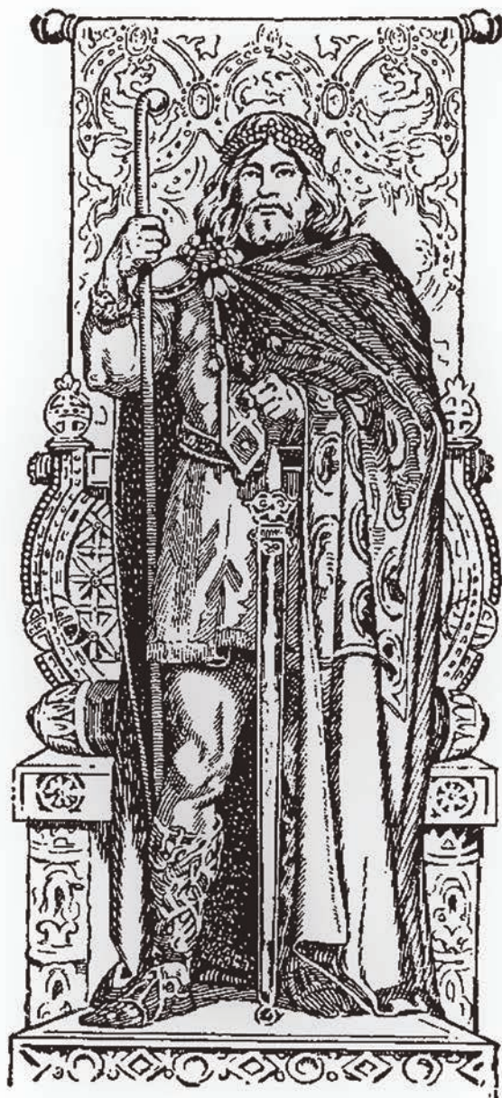
Theoderik den store.

Østgoterne var blitt de nye herrer i Italia, og de blandet seg med, og skulle leve side om side med, romerne i mange hundre år. Herulene fikk reisepass, og ble tilkjent en egen stat i dagens Beograd.